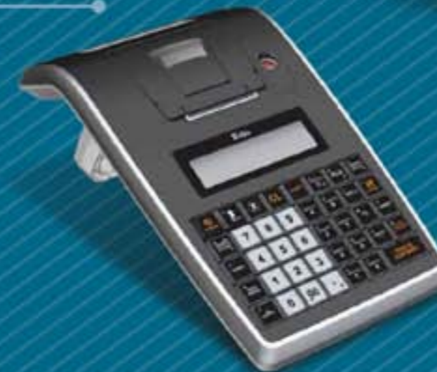
RBS EDO web