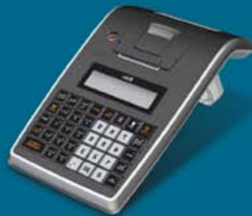
RBS EDO web