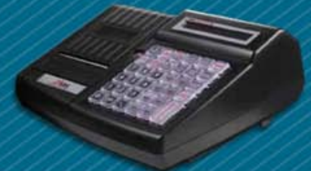
RBS MERCATO Net