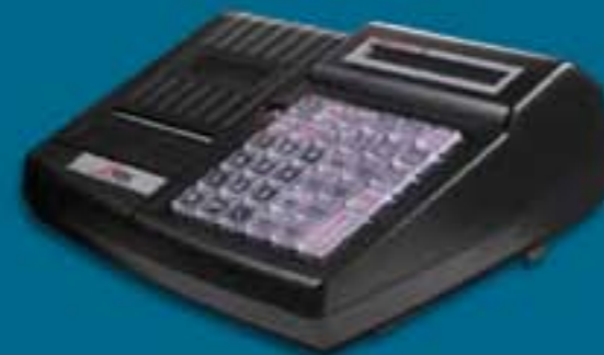
RBS MERCATO Net