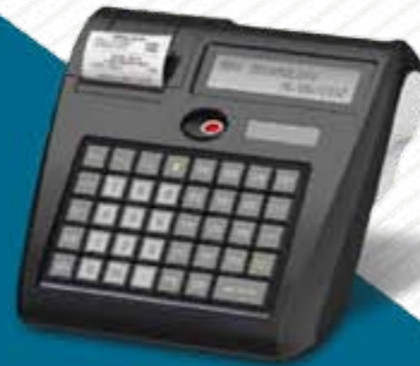
RBS ELIO web