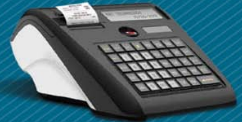
RBS ELIO web